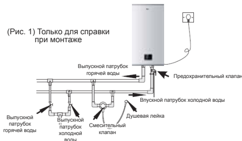
(Рис. 1) Только для справки при монтаже