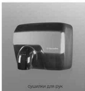
сушилки для рук