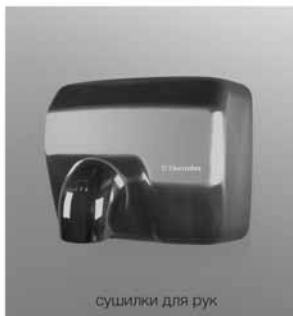
сушилки для рук