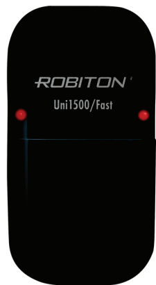
Инструкция по эксплуатации