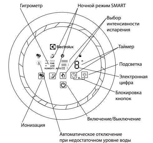
Рис. 3. Дисплей и панель управления