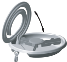
Рисунок 3 - Положение ТЭН для очистки

Парковый проезд, 1, г. Златоуст, Челябинская область, Россия, 456208