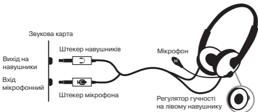
Мал. 1. Схема підключення