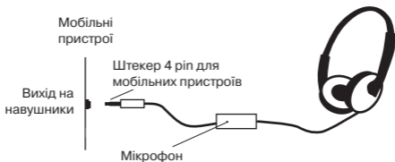
Мал. 1. Схема підключення