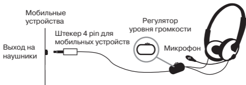
Рис. 1. Схема подключения