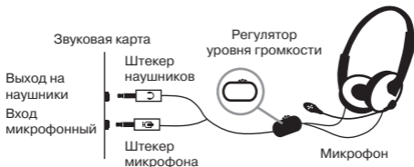
Рис. 1. Схема подключения