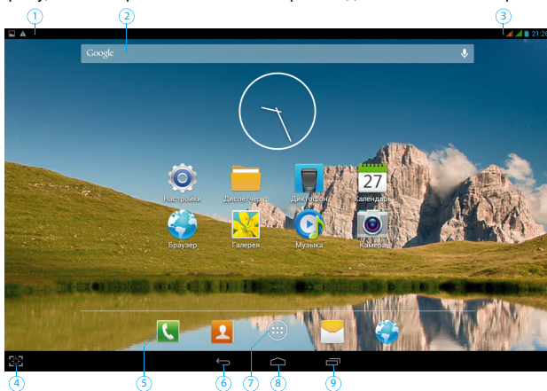
(Рис. 1) Основной интерфейс

Основной интерфейс отображается после включения и разблокировки планшета (Рис. 1). На нем расположены виджеты, ярлыки приложений, значки состояния и другие элементы. Проведите пальцем горизонтально по экрану, чтобы перейти к левым или правым дополнительным экранам.