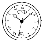
[Модули 383 и 397]