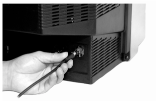
Схема подключения антенны через DVB-T2 приемник. Необходимо включить функцию питания антенны на приемнике.

С. Подключите штекер коаксиального кабеля к антенному входу телевизора