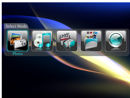
Photo (Фотографии): отображение слайд-шоу фотографий в формате JPEG.

Меню выбора режима отображается после выбора источника файлов. Используйте это меню для выбора отображаемых файлов.