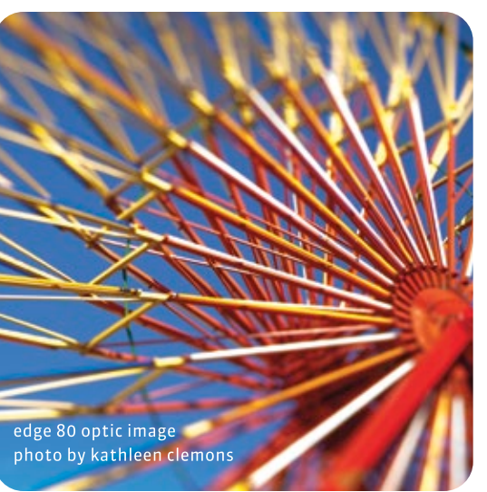
edge 80 optic image

RU Если Composer Pro поставляется с установленной Double Glass Optic, можно извлечь диск диафрагмы, коснувшись его концом инструмента для диафрагм и медленно переместив наружу. Вставьте новый диск. Если Composer Pro поставляется с лепестковой диафрагмой, инструкции по изменению диафрагмы см. в руководстве пользователя. Размер зоны лучшего фокуса контролируется с помощью диафрагмы. Чем шире раскрывается диафрагма, тем меньше становится зона лучшего фокуса.