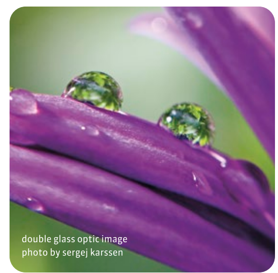
double glass optic image