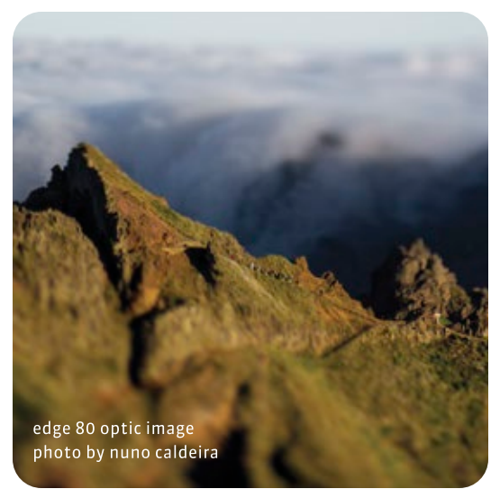
edge 80 optic image

RU Ознакомьтесь с нашими ресурсами в Интернете. Черпайте вдохновение в наших фотогалереях, получайте советы и постигайте приемы съемки с помощью наших обучающих видеороликов или общайтесь с такими же любителями съемки с помощью Lensbaby и профессионалами на нашем форуме. Не откладывая, посетите lensbaby.com .