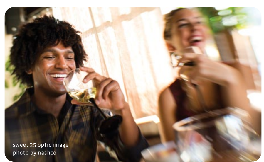
sweet 35 optic image